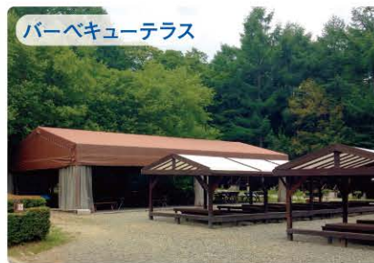
バーベキューテラス

宿泊はソファやベッドを備 えたテント、食事はレスト ラン監修の地元食材を使ったメ ニューで、自然にふれながら 快適なキャンプが楽しめます。