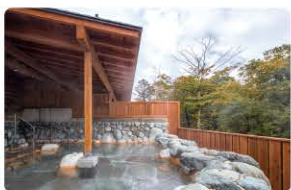
森に囲まれた露天風呂