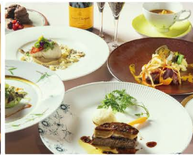
八ヶ岳の味覚を楽しめます