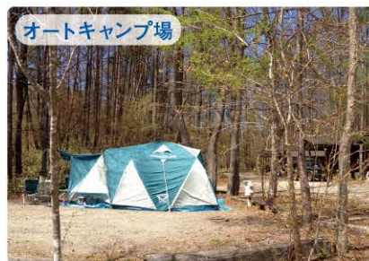
オートキャンプ場