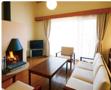
新館の暖炉付き洋室