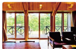
コテージの外には森が広がる