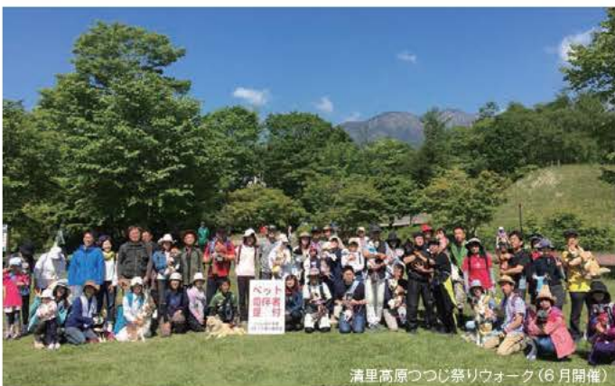
清里高原つづき祭りウォーク(6月開催)

清里高原のワンちゃん大歓迎の施設5軒が集まって、 清里が「ペットにやさしい観光地 No.1」となるよう 活動をしています。